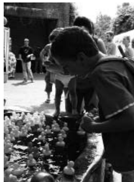
Enten angeln - Brunnenfest 2008